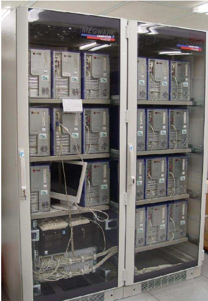
20 nodes dual XEON, 2.4 GHz

Wer möchte diese Rechner per Hand installieren?