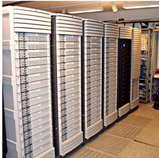
90 dual Itanium 2, 900Mhz